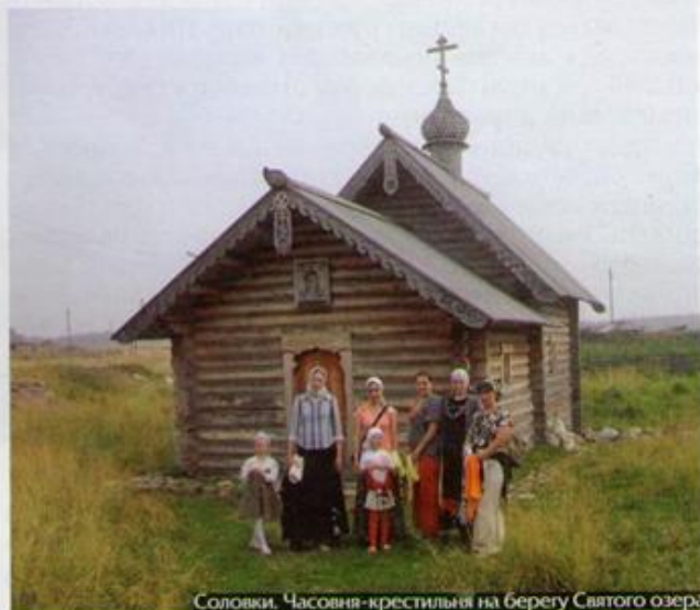
Соловки. Часовня-крестильня на берегу Святого озера