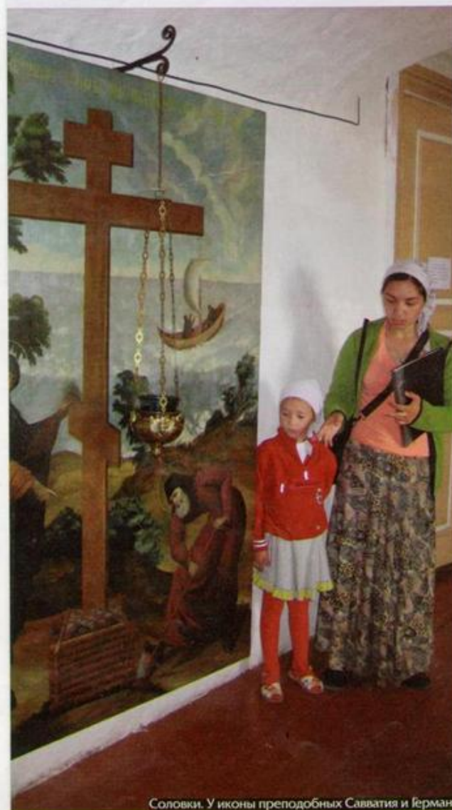
Соловки. У иконы преподобных Савватия и Германа