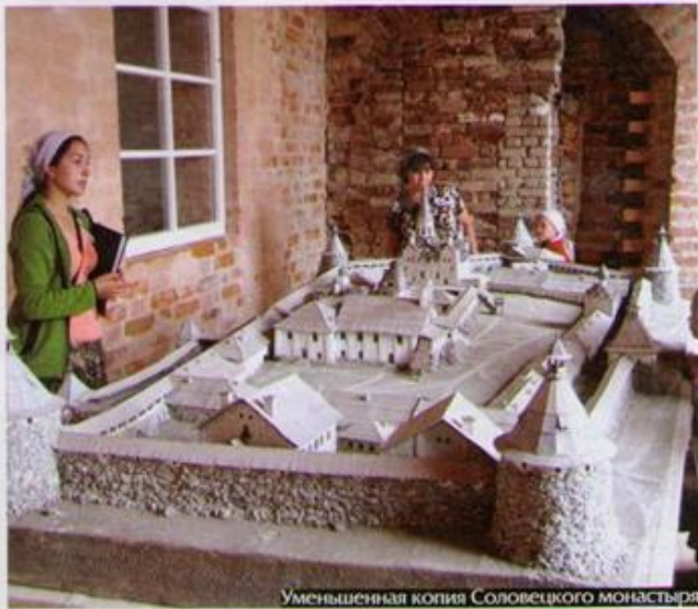
Уменьшенная копия Соловецкого монастыря