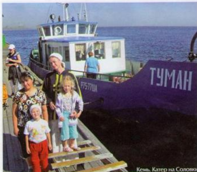
Кемь. Катер на Соловки