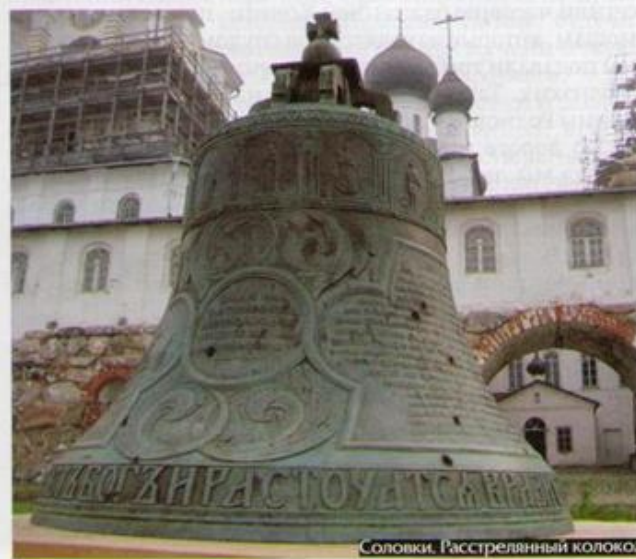
Соловки. Расстрелянный колокол