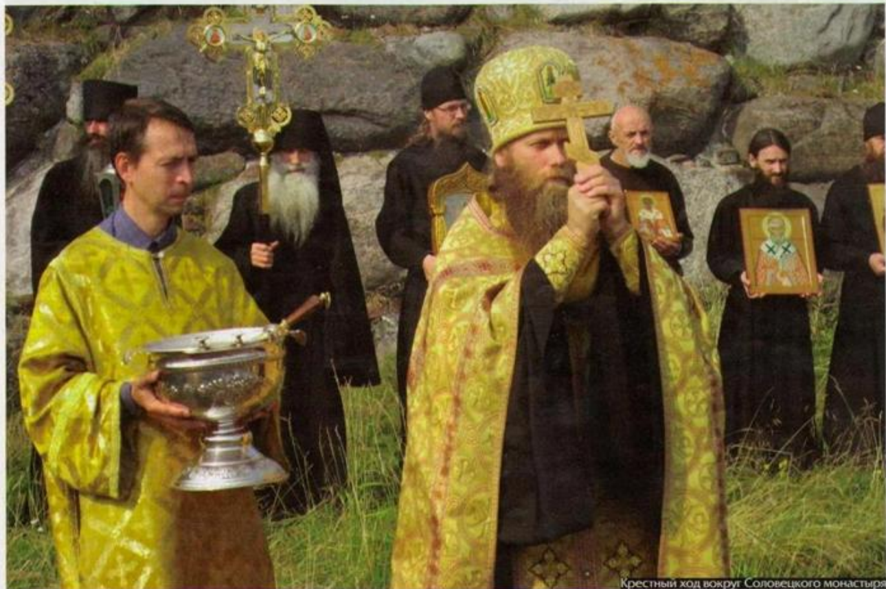
Крестный ход вокруг Соловецкого монастыря

Через три часа пути на фоне чистого голубого северного неба показались белые церкви за могучими темными каменными стенами монастыря. Прибывая на катере в бухту Благополучия, все услышали колокольный звон, который возвещал о начале вечерней службы. А на берегу нас встречала моя старшая сестра. Погода была теплая и солнечная. Мы сошли на берег и прямо с рюкзаками по каменистой дороге пошли на вечернюю службу. Все вокруг было величественно и строго. Темные башни крепостных стен с деревянными крестами и крышами были похожи на русских богатырей, закрывающих собой белокаменную церковь-невесту. На службе в древнем большом храме тихо пели монахи, но все было слышно и понятно. Мы приложились к святым мощам Зосимы, Савватия и Германа и пошли в палаточный город на